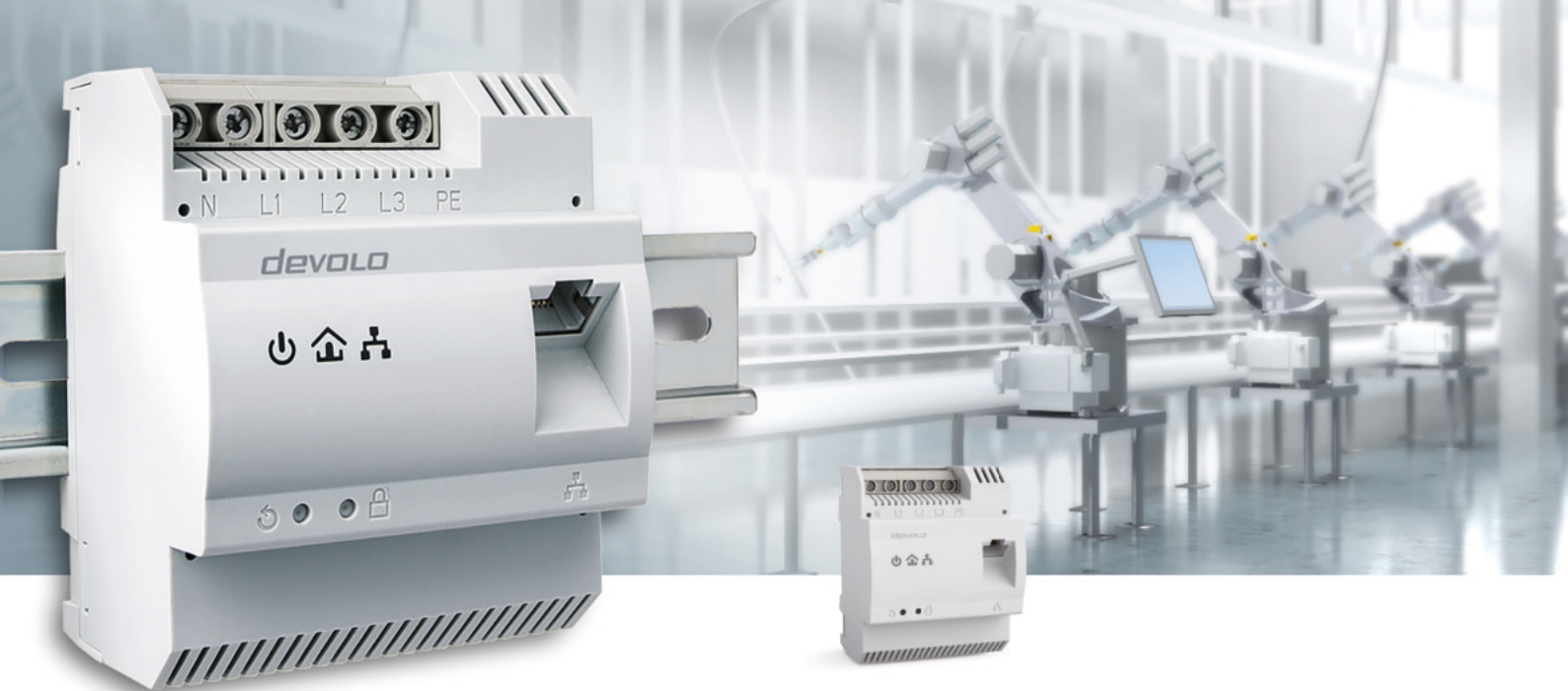
Single Adapter Art.: 9727 (CH)