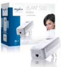
dLAN® 500 AVplus