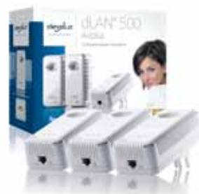
dLAN® 500 AVplus Netzwerk Kit