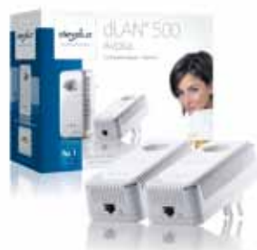
dLAN® 500 AVplus Starter Kit