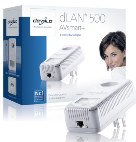
dLAN® 500 AVsmart+

Zeigt Status und Verbindungsqualität zu den anderen Adaptern im Heimnetzwerk.