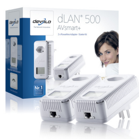
dLAN® 500 AVsmart+ Starter Kit